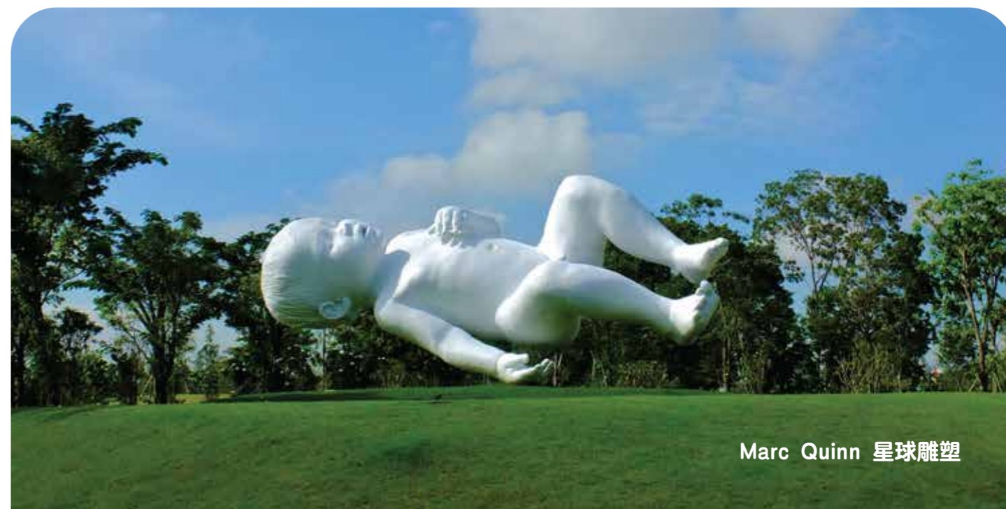
Marc Quinn 星球雕塑