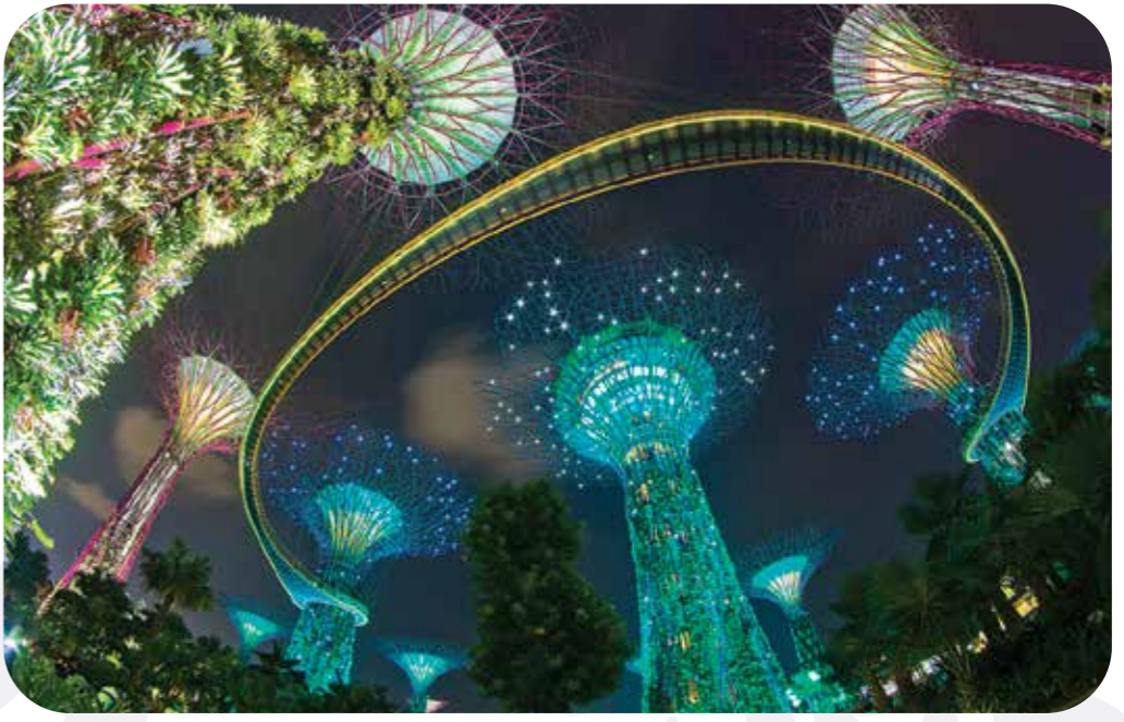
花园狂想曲 每天晚上7:45和8:45，倾情打造的声光秀定会带给您一场美轮美奂的视听盛宴，全面唤醒您的感官！